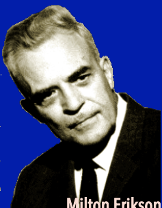
Milton Erikson (1901-1980) grande rinnovatore della ipnosi moderna.

Il Corso Base di IPNOSI, realizzato da Psicotecnica, offre la possibilità di conoscere da vicino (in modo serio e scientifico), cioè di apprendere direttamente nella continua pratica delle esercitazioni, questa straordinaria tecnica di comunicazione e di interazione.