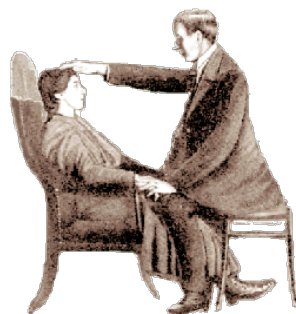
Induzione classica di rilassamento

A conclusione del Corso Base di IPNOSI: viene rilasciato un attestato di frequenza o Diploma di IPNOLOGO