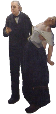
Jean-Martin Charcot (1825-1893) conduce una dimostrazione ipnotica all'Ospedale Salpêtrière di Parigi